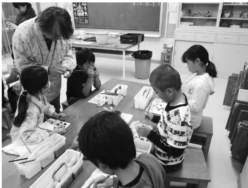
▲伝統工芸（芝原人形）体験（東・西小、4年生）

事業」を創設したが、夢事業では合計約7000万円を、今回の事業では年間に300万円を使いますが、近隣でこの様な事業があるか。②今回の事業では芸能・文化等の体験のほか、漢字検定の受験もあるが、他の資格取得もサポートできないか。について伺います。