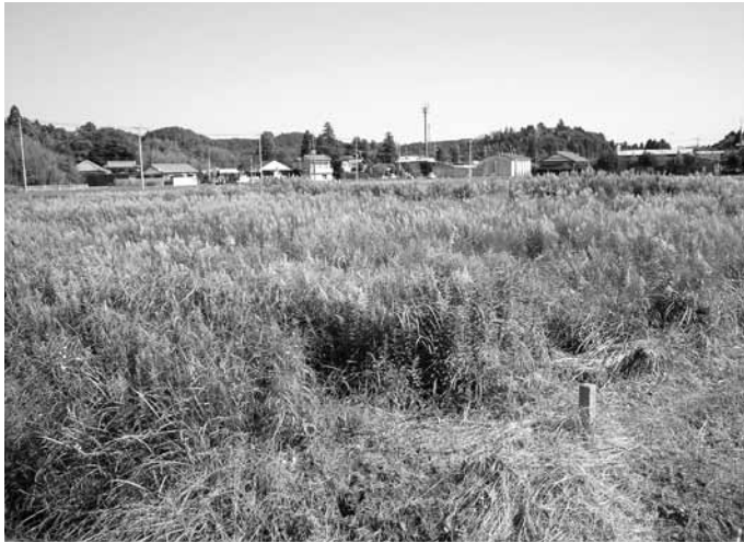
▲耕作放棄地の解消は

平成23年3月現在放棄地が233ヘクタール（町の農地の15%）その内農業振興地内に60ヘクタール。さらには場