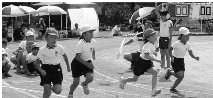
▲熱中症対策は万全に

るそうです。水道水を使用するため、環境にも優しい特性があり、涼しくて心地よいと好評です。このミストシャワーの設置についても、併せて伺います。