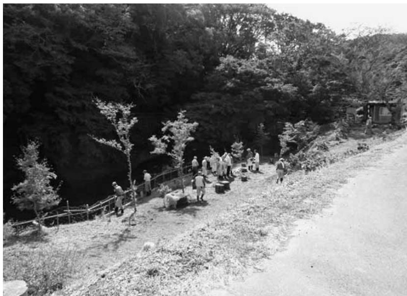
▲地元で整備を行った公園（蔵持字平蔵辺田地先）

にすること。②周辺の整備として対岸の赤道の通行保護用にある老朽化している鉄柵を補修することについて伺います。