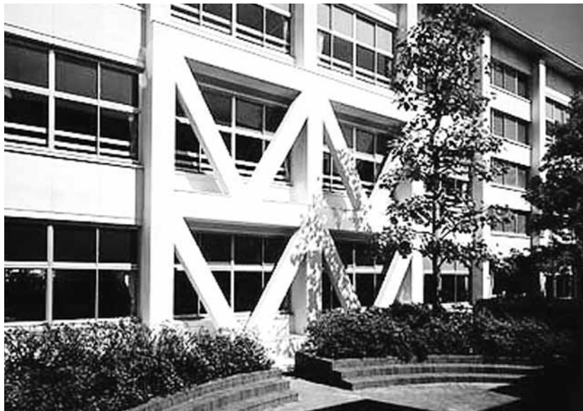
▲補強工事のイメージ

耐震改修方法や耐震工法などを比較検討した結果、経費的な内容に重点を置き、枠付鉄骨ブレースをフレーム内に取り付ける耐震補強計画が現時点では最適であると判断しています。工事費約3億3000万円程度の工事になります。なおエレベーター設置