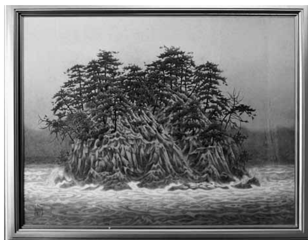
▲絵画「幸せの島」関 主税作

答 長南町出身の日本画家関主税氏から平成9年10月に200万円で購入したものです。展示については、教育委員会や執行部で協議し、多くの方に知っていただく機会が取れるよう検討します。