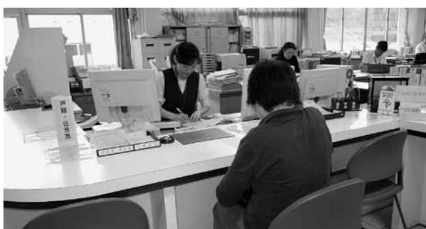
▲窓口対応の状況は

問 町民より役場職員の窓口対応や、身だしなみが悪いとの指摘が多数あります。どのような職員教育をしているのか伺います。