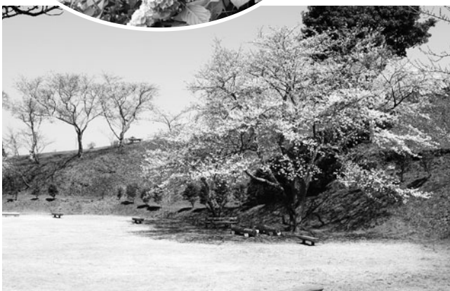
▲花の時期の野見金公園