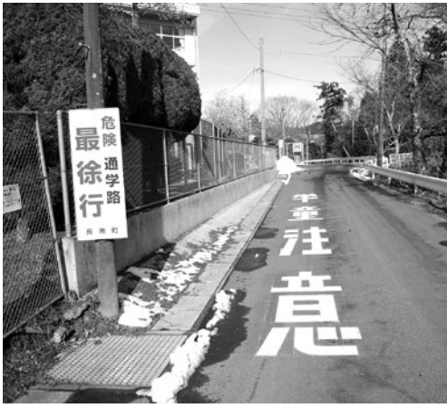
▲町PTA連絡協議会の要望により行われた道路標示(長南小学校前)

毎年、夏頃、町のPTA連絡協議会会長から通学路危険箇所改善要望事項として提出され、それを総務課・教育課・事業課の合同で現地を確認し、町だけで対応できるものは迅速に対応させて頂いております。