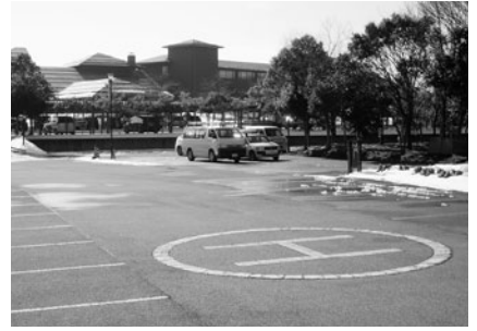
▲災害時に有効では (グレートアイランド倶楽部のヘリポート)