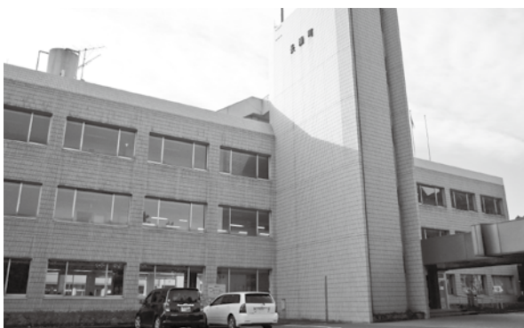
建替えが検討されている役場庁舎

された介護保険法等の一部改正に伴うシステムの一部を改修する必要が生じたことから増額し、予算の総額を10億7831万5千円にするものです。