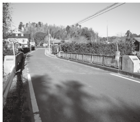
今年度実施予定の千手橋

修繕工事の進捗状況は、『早期に措置を講ずべき状態』に判定された橋梁が17橋あり、本年度実施するものを含め4橋が完了するの見込みです。また、コスト削減につながる新しい技術については活用を図ってまいります。