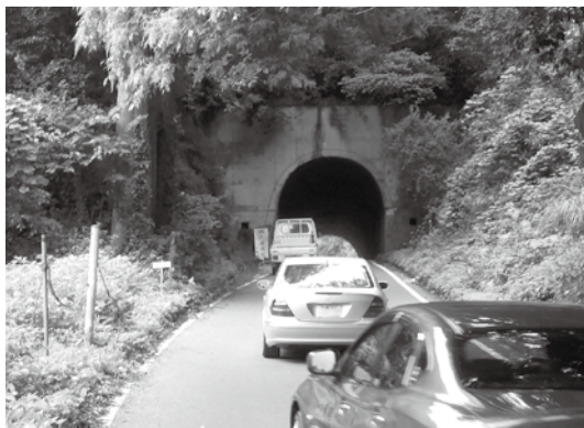
早期整備が望まれる南郷トンネル

本町を始めとする長生郡市においては、広域幹線道路の整備促進が図られているが、6月2日に三郷ICから高谷JCT間が開通した外環道や圏央道の整備効果を確実に受け止めて、長生郡市や外房地域の更なる発展に繋げるべく、長生地域内の道路整備を要望するため、千葉県知事に意見書を提出するものです。