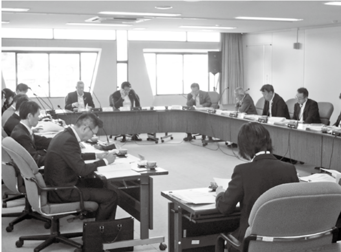
千曲市での意見交換