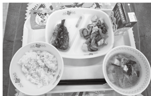
小学生向け（食材費は265円）

り、気になるのが主食です。近年小麦による腸のトラブル、精神疾患、認知症、皮膚疾患、糖尿病、肥満など様々な報告があります。既に主食はほとんど米飯になったと聞きました。が、いつ頃からか、その理由と近隣自治体の状況は。また、米飯と牛乳は合わないと思いますが、考えをお聞きます。