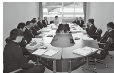
7～9 教育民生常任委員会