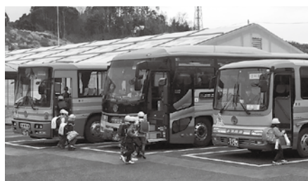
スクールバス乗降の様子

の利用につきましては、4小学校統合による通学の長距離化に対応するもので、中学生につきましては、下校時刻の違いや部活動あるいは登下校に係る指導面、定員の面からも現時点では考えていません。