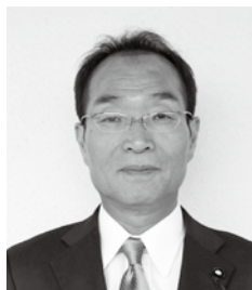
副議長 岩瀬 康陽