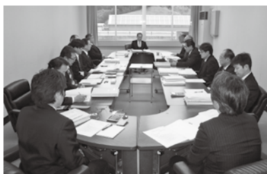
4～6 産業建設常任委員会