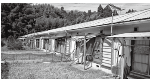
今後のあり方が検討される町営住宅