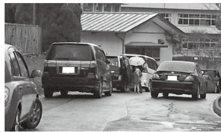
保育所送迎の様子

現状では乗せられませんが、③花壇の撤去、フェンスの移動、町道拡幅など検討はしています。が実施には至っていないので、他の対策も含めて再考します。