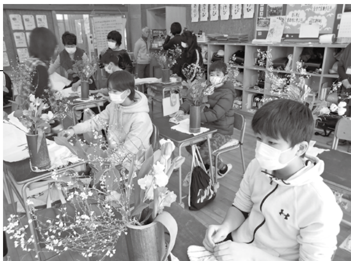
ふるさと学習の「生け花」を体験