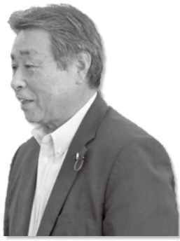
宮崎 裕一 議員