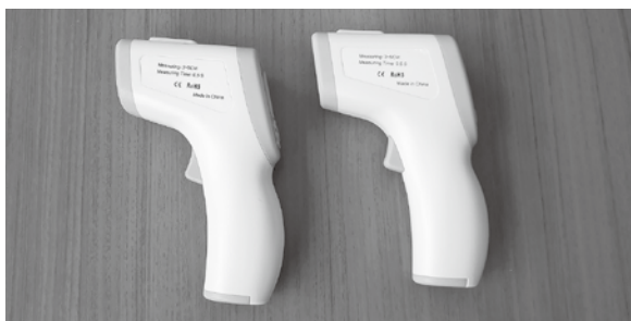
購入した非接触式体温計