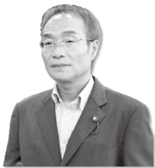
岩瀬 康陽 議員