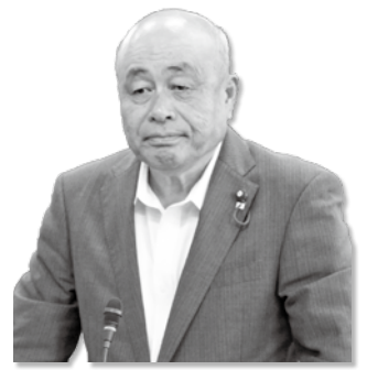
加藤 喜男 議員