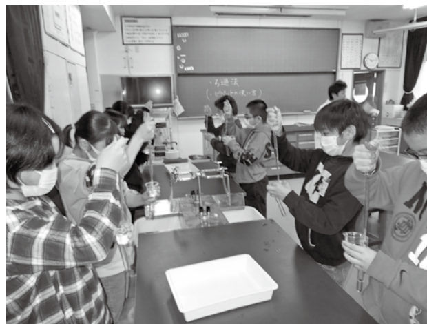
5年生の理科の授業風景

5月から小・中学校は分散登校とし、小学校は保護者の送迎による地区別登校、担任面談、生活状況確認を。中学校は、各クラスを2グループに分け、週に一度、午前中のみとしました。再開に備え、文部科学省からの指示に基づき対応に当たっています。