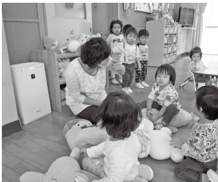
保育室に現在設置中の空気清浄機

現在、保育所での空気清浄機は、朝と夕方の送迎時に多くの子どもが集まる、1歳児の保育室に1台設置してあります。保育所に適した空気清浄機を設置したいと考えています。