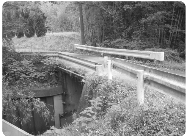
第一 五場橋 (坂本地先)

町が管理する橋梁は全体で146橋です。50年を経過した橋梁が24橋、40年を経過した橋梁は40橋、30年を経過した橋梁が25橋。20年後に建設後50年を迎える橋梁の数は89橋で、全体の61%になります。過去5年以内の橋梁の点検は、職員による日常の巡回の際、目視点検にとどまっています。また、町3ヶ年実施計画に基づき、橋梁の長寿命化修繕