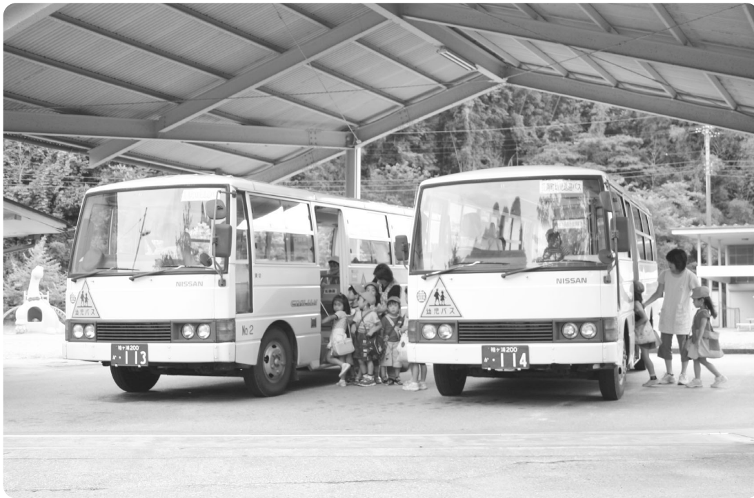
更新計画がある保育園児送迎用バス（左：平成7年車 右：平成6年車）