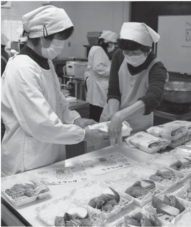
ボランティアによる給食サービス