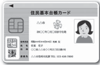
住民基本台帳カード(見本)

主返納した方等への住民基本台帳カードの無料発行など、取り組む考えがあるか伺います。