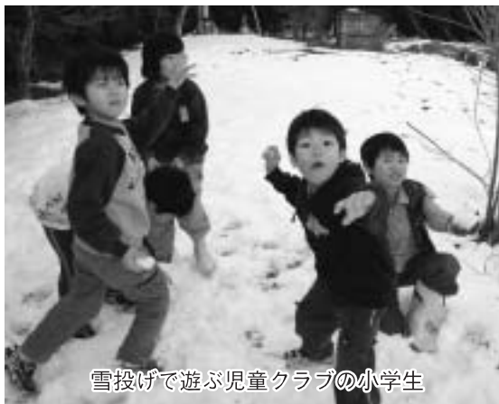
雪投げで遊ぶ児童クラブの小学生

1月21日(土) 未明から翌日にか けて降り続いた雪は、多いところで 20cmの積雪になりました。