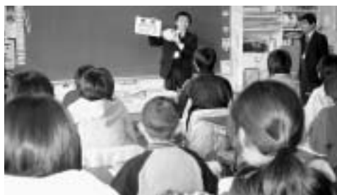
税務課職員による授業の様子

東小学校で、「買い物をしたときに支払う消費税は、年間で10兆円集まります。その税金は巡り巡って、教育費などに充てられています」と税金の話をしました。支払った消費税が身の回りで使われていることを児童は知り、税金の必要性を学びました。