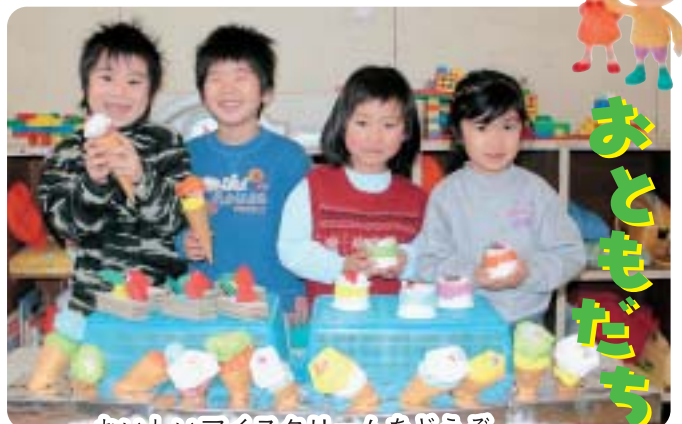
おいしいアイスクリームをどうぞ