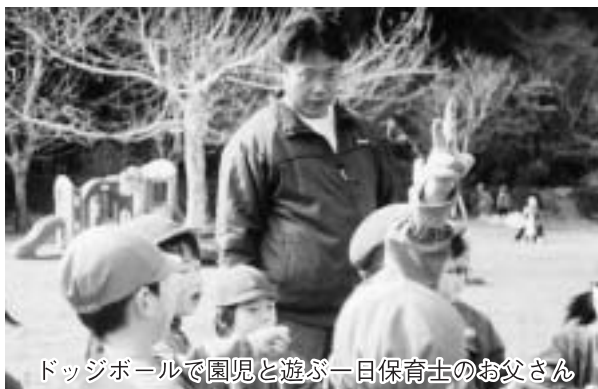
ドッジボールで園児と遊ぶ一日保育士のお父さん

一日保育士を務めたお父さんは「忙しくて子どもとあまり遊ばないので、子育ての苦労や妻の大変さを知ることができました。他のお父さんにも体験してもらいたいですね」と体験の感想を話しました。