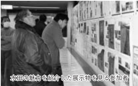
水田の魅力を紹介した展示物を見る参加者

埴生川最上流の埴生川3期地区ほ場整備事業を行なった長南町を会場に、長生農林振興センターが『田んぼの魅力再発見！農村の底力』と題した講演会を2月18日（土）に開催したところ、120人が中央公民館に参集しました。 講演では、田んぼ周辺の生き物や農業にまつわる暦や行事から身近にあるものを再発見し、世代を超えて一緒に考え、行動するときの接点にして基盤整備後の集落営農の活性化について考えるものでした。