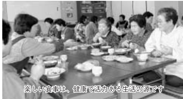
楽しい食事は、健康で活力ある生活の源です

食を通して、健康で活力のある暮らしを作り出すためには、家族全員で食卓を囲み、会話をしながら楽しい食事をするように心がけましょう。