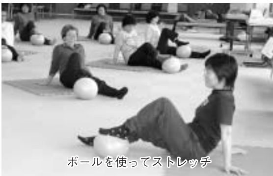
ボールを使ってストレッチ

生活習慣病を予防するために運動の習慣を身に付け、体力の維持に努めようと、月1回保健センターで行ってきたエンジョイスポーツ教室。 2月15日（水）の教室は、前回実施した体力測定や食事歴調査の結果を保健師などが個別相談した後、健康運動指導士がボールなどを利用したストレッチ運動の復習をしました。 指導士は「短期間で効果はできません。続けることが大切です」と助言し、参加者は「体を動かすと軽くなります」と、この教室を楽しんでいました。