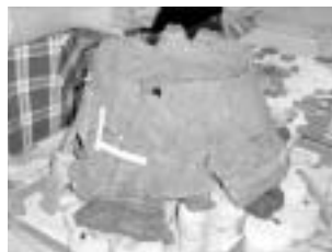
(町資料館 風間俊人)

もし、現在言われている首都圏大地震や東海大地震が、このように短期間に発生したら...コワイ話です。この火山灰層の下からは中