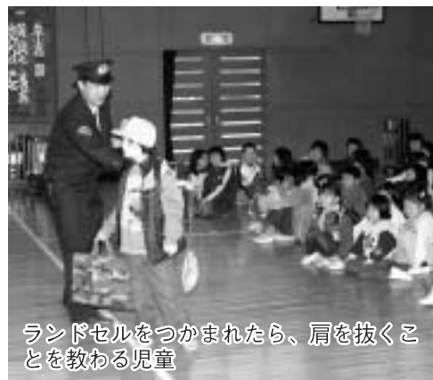
ランドセルをつかまれたら、肩を抜くことを教わる児童

常に児童に防犯の意識を持ってもらうと、2月16日（木）に長南小学校で茂原警察署の警察官を招き、防犯教室を行いました。 児童は、犯人役先生に後ろから腕をつかまされると、一瞬の出来事に驚いて、声もだせませんでした。 警察官から「ランドセルをつかまれたら肩を抜くことや、車に乗せられそうになったらドアを足で蹴ること」など万々に備え、身を守ることを学びました。