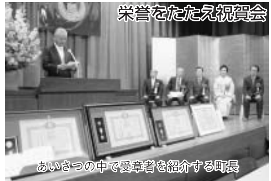
栄誉をたたえ祝賀会

多年にわたり各界で活躍され、叙勲や大臣表彰を受章された方々の祝賀会を2月20日（月）に中央公民館で開催しました。