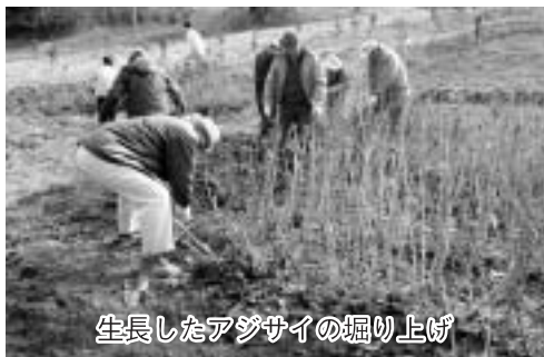
生長したアジサイの掘り上げ