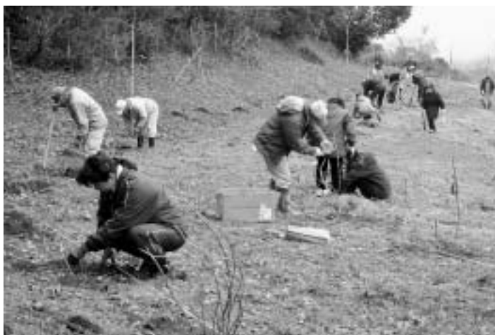
桜の木々の間にアジサイを植え込みアジサイロードづくり

住民による手づくりの野見金公園で2月12日（日）、アジサイボランティアの皆さんが2年前に挿し木したアジサイの堀上を、19日（日）には桜を植樹した方など100人を超える皆さんで、アジサイロードづくりを行いました。 ご協力していただいた皆さん、ありがとうございました。