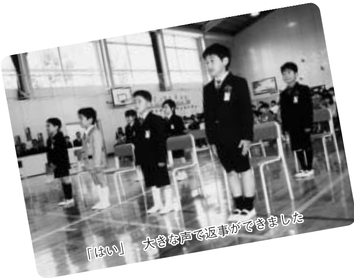
「はい」 大きな声で返事ができました