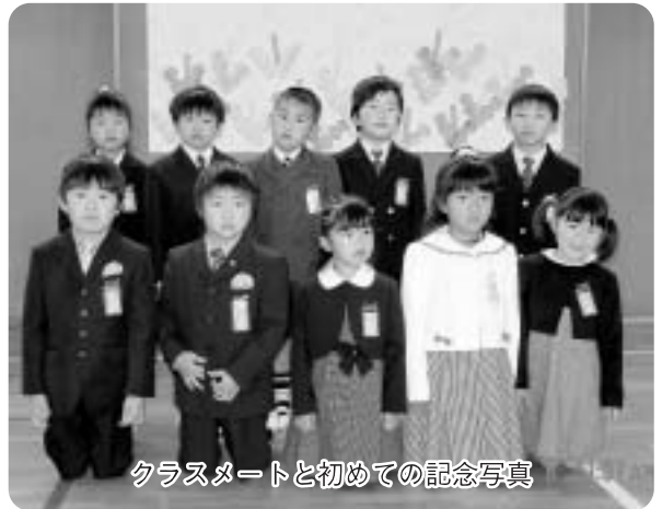
クラスメートと初めての記念写真