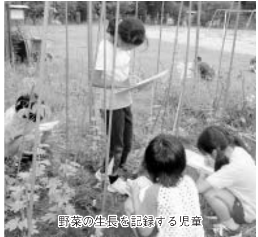
野菜の生長を記録する児童

町内の小学校では総合学習の時間を利用して、農業体験を通して地域の生産者と交流を行い、野菜の植え付けから収穫までを学んでいます。校内の農園や近くの水田を借りて、農業体験から土や自然に触れる楽しさ、作物を育てる大変さを児童は心と体で感じ取りながら生き生きと取り組んでいます。愛情をかけた分だけすくすくと育った作物を収穫し、調理実習で食べる喜びも味わっています。 学習の中で『食』から『農』を身近に感じる体験を学校は取り入れているのです。