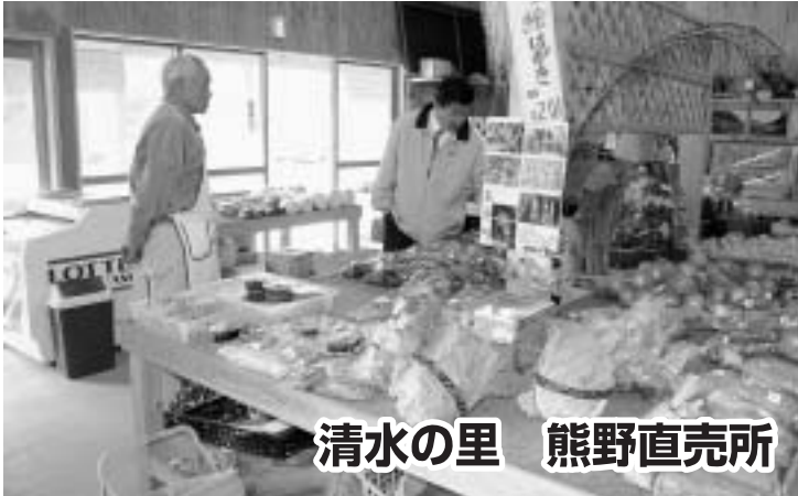
清水の里 熊野直売所

どこの産地のどんな野菜なのかわからないものより、地元のもの食べてもらいたいですね。今、キャベツが収穫できますが、チョウが来ないようにネットをかけるなどして安全性を考えていますし、朝収穫するから新鮮です。