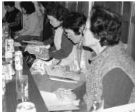
丁寧なレッスン指導にメモを取る皆さん