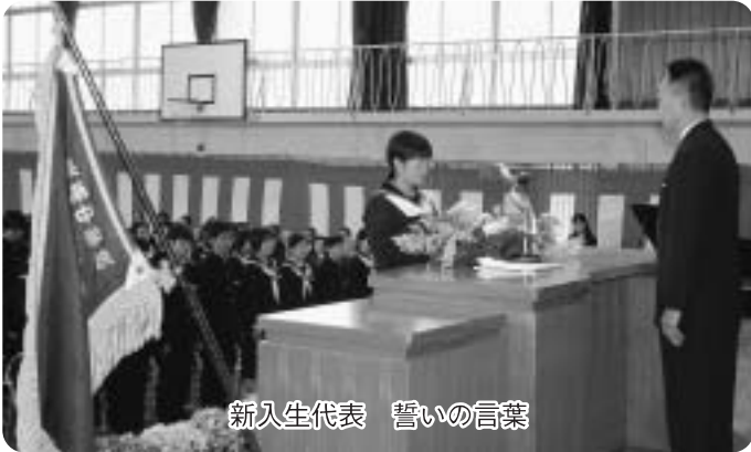
新入生代表 誓いの言葉