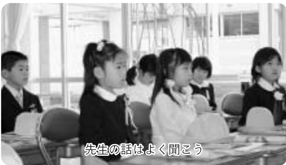
先生の話はよく聞こう