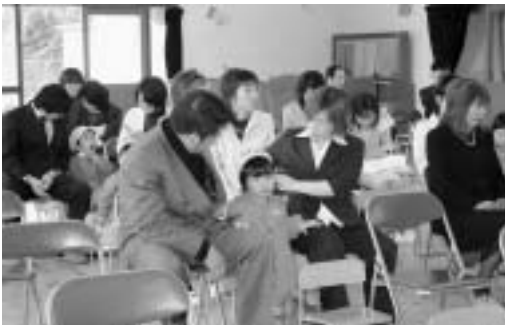
「何が始まるのかな」