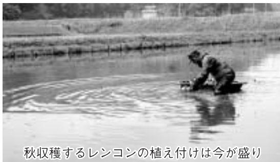
秋収穫するレンコンの植え付けは今は盛り

週4回の米飯給食です。その米は長南町をはじめ、睦沢町、長柄町、茂原市のコシヒカリが使用され、ご飯のほかに