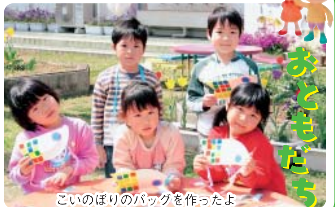
こいのぼりのバッグを作ったよ