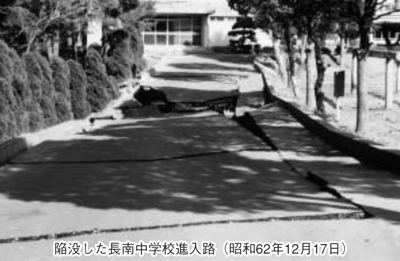
陥没した長南中学校進入路（昭和62年12月17日）