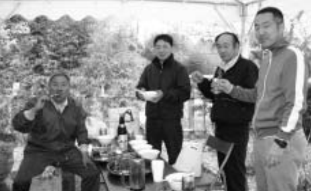
焼き鳥を片手にコミュニケーション

子どもたちからは「おいしい」と声が上がりましたが、お年寄りからは「こういう会があると、近所の人の顔を覚えらるよ。今日は楽しいね」と笑顔で話してくれました。