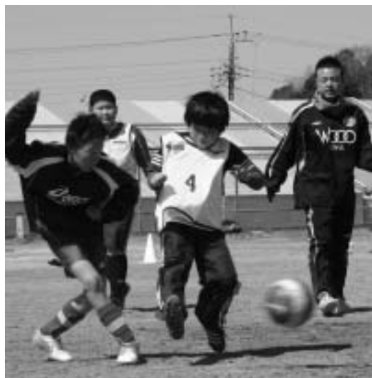
ミニゲームをしながら技術を習得

参加した子どもたちからは「2日間すごく楽しかった。うまくなれそうです」、練習を見守っていた保護者からは「また、このような教室を開いてもらいたいですね」と、2日間の感想を話してくれました。