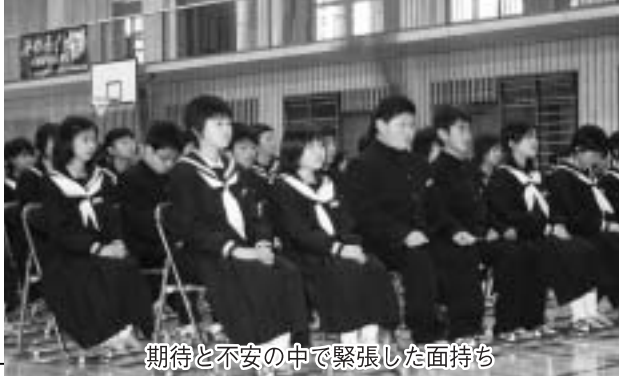
期待と不安の中で緊張した面持ち

地域のお話をお寄せください 企画財政課広報統計係 ☎ 4 6 — 2 1 1 3