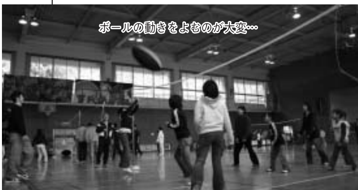
ボールの動きをよむのが大変...

体を動かしてお腹がすいたところで、おいしい豚汁を参加者全員で食べ、その後、抽選会を行い予想以上の盛り上がりでした。