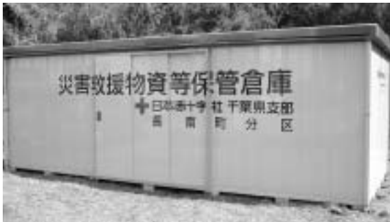
日赤千葉県支部より、災害対策支援として災害救援物資保管倉庫と災害時炊き出し用大釜が設置されました。