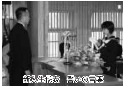
新入生代表 誓いの言葉

長南中学校 78人 長南小学校 12人 豊栄小学校 14人 東小学校 19人 西小学校 16人