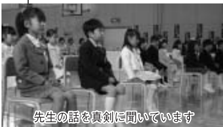
先生の話を真剣に聞いています