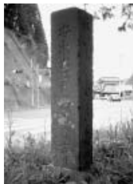
道標の周囲は時の流れから取り残された空間のよう

きく円を描くように巡った後、三浦半島対岸の館山市の那古寺を終点とするなど、明らかに鎌倉中心のコースです。元来、こうした巡礼は信仰のための修行・苦行としての性格が強かったのですが、江戸時代になると庶民のレジャー的な要素が強まってきました。この時代、大多喜街道と巡礼道が交差する長南宿は多くの旅人でにぎわっていたことでしょう。古びた道標はその日々を静かに物語っています。