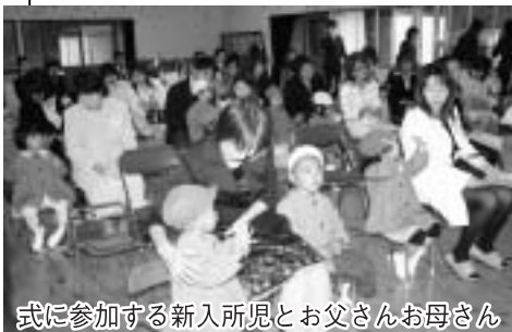
式に参加する新入所児とお父さんお母さん