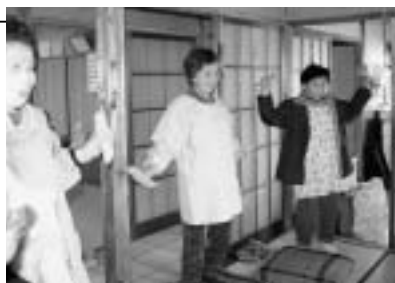
手首を内側に曲げるようにしてダンベルを持つのがコツ

第1回目の講座に伺ってみると、布袋の中に玄米が入ったダンベルを使う「玄米ダンベルニギニギ体操」を行っていました。この体操は幼児からお年寄りまでだれもができ、1日15分程度、体に負担をかけないように行うことで、脳を活性化し高齢者の自立を促すそうです。参加者は「このダンベルは、玄米の香りがします。これで肩をたたくと気持ちいい」「なるほど、こうやるのね」とダンベルを手に話してくれました。