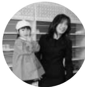
「お友だちがいっぱいできるといいな〜」

新生活を前に子どもたちの中には笑顔の子や、ドキドキ顔の子とさまざまな表情を見せていました。楽しい思い出に残る保育所生活を送ってください。