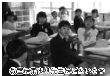
教室に集まり先生にごあいさつ