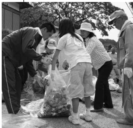
40分程でこんなに集めました

今年収集されたゴミの量は、2トントラック14台分で、3,140kgもありました。来年は、今年よりも少ないゴミの量になるようにしましょう。ご協力いただいた皆さん、ありがとうございました。