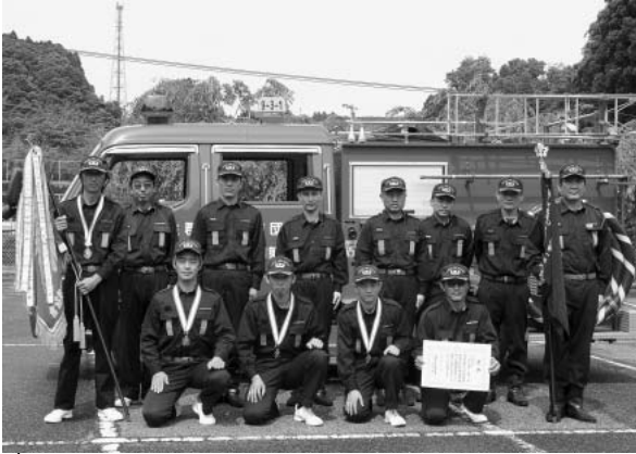
ポンプ車操法団体の部で最優秀賞に輝いた 第3分団第1部の団員