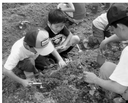
「ちゃんと育つかな」秋の収穫が楽しみ

さつまいもは、10月中旬頃に子どもたちによって収穫されます。大きくおいしさつまいもが育つといいですね。