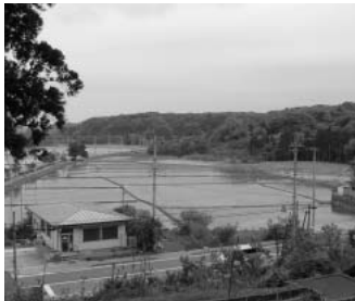
（町資料館 風間 俊人） 八幡神社境内からの眺めは、600年前の情景を想起させる

の手この手で作戦を仕掛けていました。一筋縄ではいかない農民と領主である八幡宮との間に立つて、平田（岩名手と同一人物との説あり）は粘り強く交渉をまとめていました。このように平田は八幡宮にとって有能な政所だったと思われる一方で、自分も八幡宮から給付された原阿弥陀堂免田の安堵料の納付免除を要求するなど、したたかな一面もあったようです。