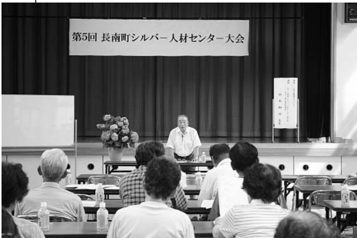
第5回 長南町シルバー人材センター大会

講師は、「就業にあたっては、どんな仕事でも、まず下見をして安全確認をすることが大切。事故を防止するのは、自己である」と事例を出しながら、安全に仕事をするにはどうすればよいかを話してくださいました。