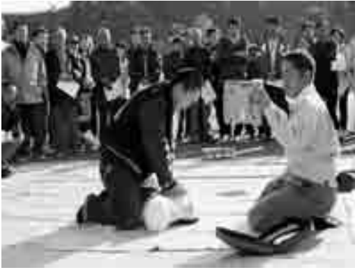
AED（自動体外式除細動器）の使い方訓練には、多くの人が集まりました。