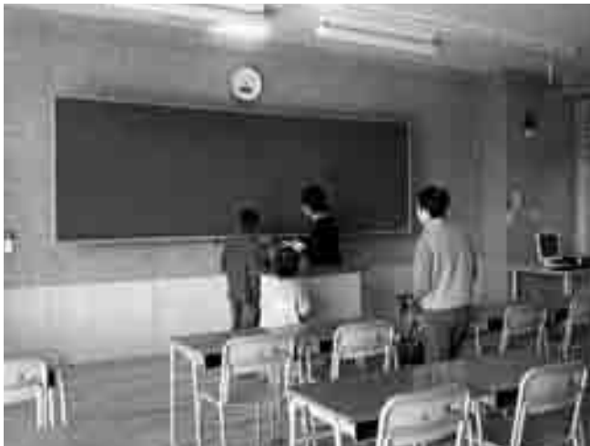
中学生になったら、ここで勉強するのよ

将来、長南中学校で学ぶ子どもや卒業生など、幅広い年齢層の人が見学していました。見学会している人にお話を伺うと「すごい一言ですね」「立派な校舎ができました」と驚いた様子で話してくれました。また、新校舎を背景に記念撮影をしている人や、校舎内をビデオカメラで撮影している人もいました。