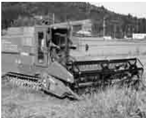
大型コンバインでの刈取りは、迫力があります。

この大豆は、出荷され国産大豆として全国で販売されるほか、近隣の豆腐屋の豆腐の原料となります。また、一般にも販売をしていて、大変人気があり、12月中にはほぼ完売してしまうそうです。