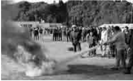
燃え盛る炎に向かい初期消火訓練