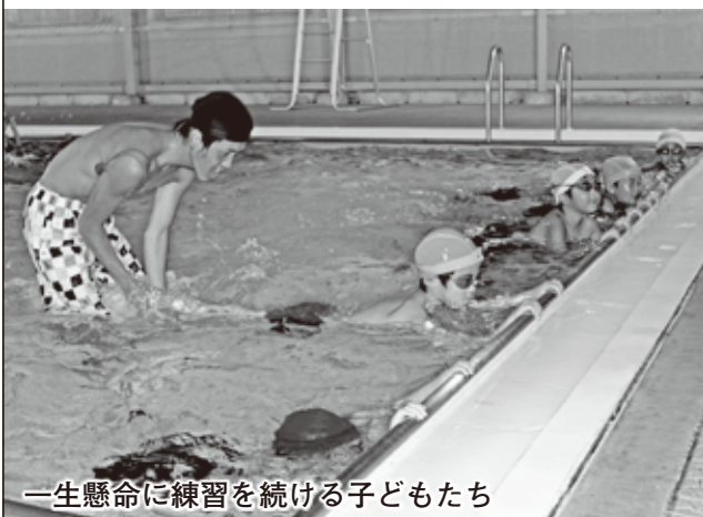
一生懸命に練習を続ける子どもたち