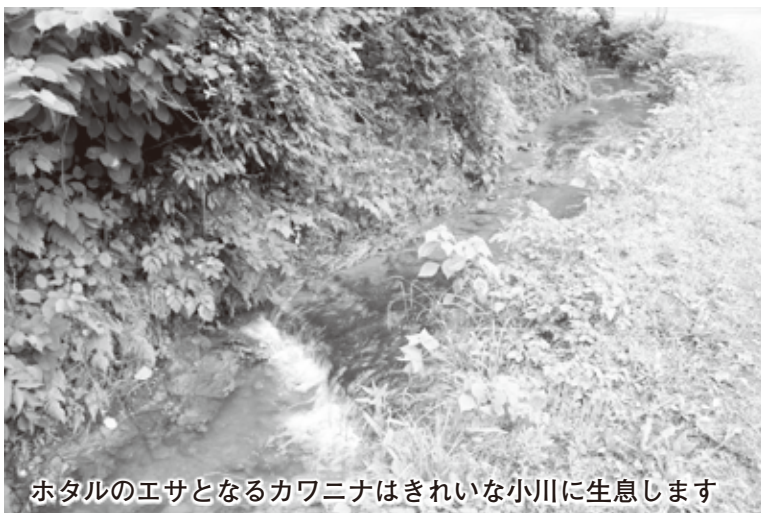
ホタルのエサとなるカワニナはきれいな小川に生息します