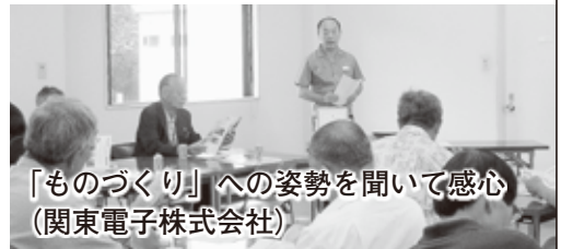
「ものづくり」への姿勢を聞いて感心 (関東電子株式会社)

参加者からは「町への理解が深まりました」「普段からなんとなく使用しているものだけれどこういう人たちに支えられているのね」と感想があり、充実した1日となりました。