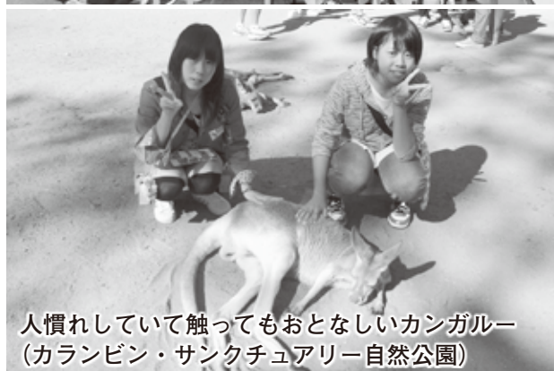
人慣れしていて触ってもおとなしいカンガルー（カランビン・サンクチュアリー自然公園）