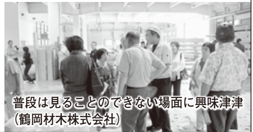
普段は見ることのできない場面に興味津津 (鶴岡材木株式会社)