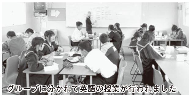
グループに分かれて英語の授業が行われました