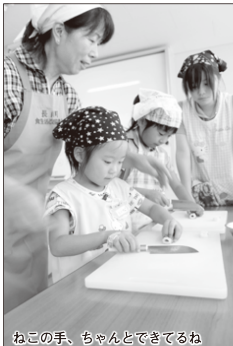
ねこの手、ちゃんとできてるね

夏休み期間中、児童クラブに来ている子どもたち（1～3年生まで）を対象に、季節の野菜を利用して「ミックスピザ、ウインナーパン、おとととシーザーサラダ、フルーツ杏仁」の4品を作りました。食生活改善推進員の皆さんに包丁の使い方やパン生地作り方などを教えてもらい、お友だちと協力しながら一生懸命に料理をしていました。感想を聞くと「楽しい。家でまた作ってみたい。」と答えてくれました。