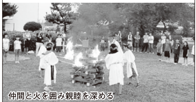
仲間と火を囲み親睦を深める

参加した児童は、「みんなで力を合わせてがんばりました。」「テントで寝たりキャンプファイヤーをしたりいい経験ができました。」「ご飯の量が多くてびっくりしたけど、おいしかったです。」「などと自衛隊の皆さんにお礼の手紙を書きました。」