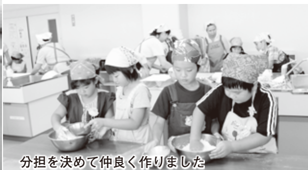
分担を決めて仲良く作りました

夏休み期間中、児童クラブに来ている子どもたち（1～3年生まで）を対象に、季節の野菜を利用して「ミックスピザ、ウインナーパン、おとととシーザーサラダ、フルーツ杏仁」の4品を作りました。食生活改善推進員の皆さんに包丁の使い方やパン生地作り方などを教えてもらい、お友だちと協力しながら一生懸命に料理をしていました。感想を聞くと「楽しい。家でまた作ってみたい。」と答えてくれました。