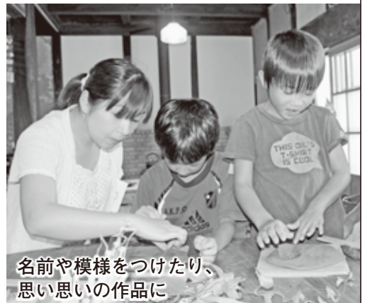
名前や模様をつけたり、思い思いの作品に