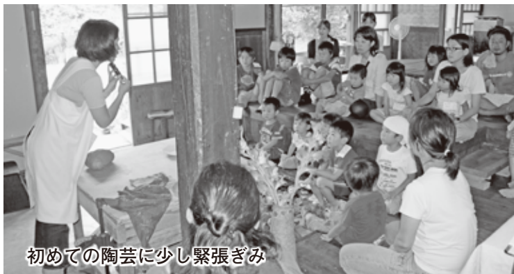
初めての陶芸に少し緊張さみ