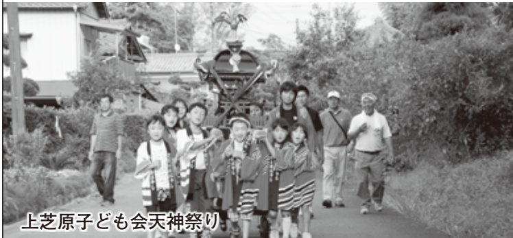
上芝原子ども会天神祭り

参加した子どもたちは、「神輿を担ぐのは楽しいよ」「毎年参加してます」と元気よく答えてくれました。