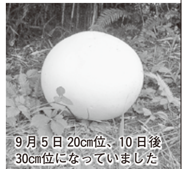
9月5日 20cm位、10日後 30cm位になっていました