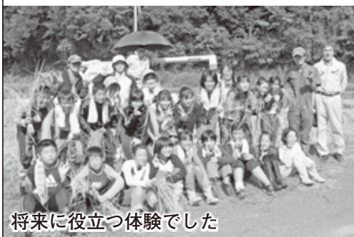
将来に役立つ体験でした

4俵程度の収穫があった稲は、農協に脱穀、精米をお願いし、11月頃には、お米を炊いて太巻き寿司にしたり、お正月飾りを作る予定だそうです。