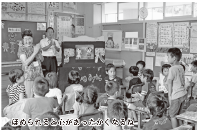
ほめられると心があたたかくなるね

その中で、「友達が困っていたら助けてあげようね」「一人で心に閉じ込めないで、大人に相談するのも勇気の一つだよ」など、子どもたちにわかりやすく人権のお話をしていました。