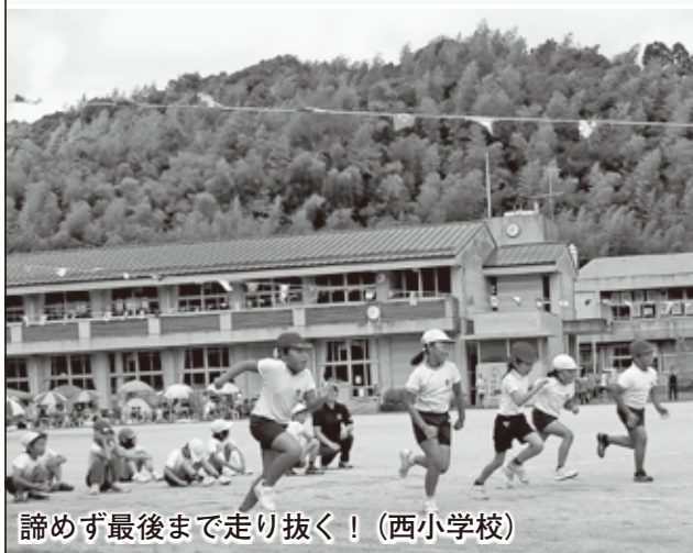
諦めず最後まで走り抜く！(西小学校)