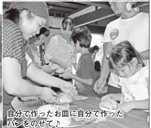
自分で作ったお皿に自分で作ったパンをのせて♪