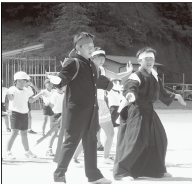
応援合戦に力が入ります(豊栄小学校)