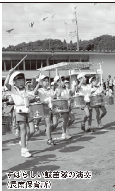
すばらしい鼓笛隊の演奏(長南保育所)

厳しい暑さが続く9月10日には長南中学校で、17日には豊栄小学校と西小学校で、23日には長南保育所でそれぞれ運動会が行われました。