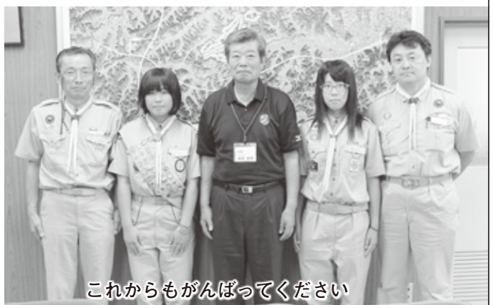
これからもがんばってください

副町長から「大変良い経験をされましたね。」と言われるとしっかりと「はい」と受け答えていました。