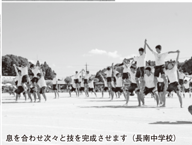
息を合わせ次々と技を完成させます(長南中学校)