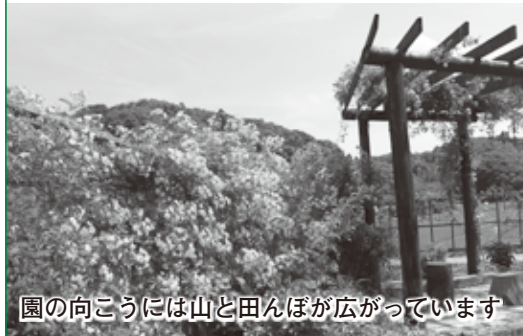
園の向こうには山と田んぼが広がっています