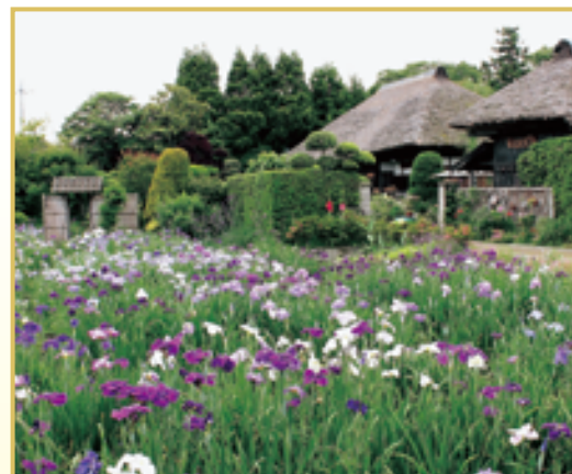
白井「田園」の花菖蒲 (岩川)