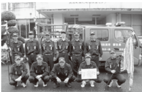
小型ポンプ操法団体の部で最優秀賞に輝いた第1分団第2部の団員