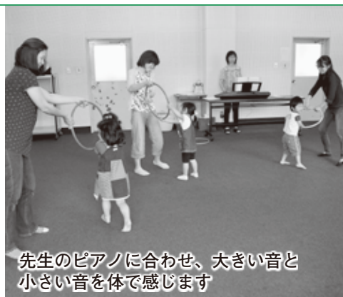
先生のピアノに合わせて、大きい音と小さい音を体で感じます

お母さんとのスキンシップを交えた手遊びでは、子どもたちの表情も穏やかになり、楽しいひとときを過ごしていました。