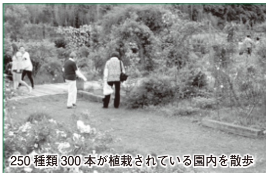
250種類300本が植栽されている園内を散歩