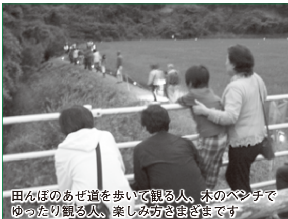
田んぼのあぜ道を歩いて観る人、木のベンチでゆったり観る人、楽しみ方さまざまです