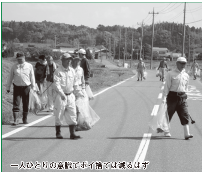
一人ひとりの意識でポイ捨ては減るはず

■収集されたごみの量 合計 可燃ごみ 不燃ごみ 3, 220 kg 2, 060 kg 1, 160 kg ゴミの不法投棄防止とリサイクル推進を目的としたゴミゼロ運動が5月27日、各自治区で一斉に実施されました。当日は約2,023人が参加し、それぞれゴミ袋を手道路や空き地などに落ちていたゴミを丁寧に拾い集めました。たくさんのゴミが皆さんの協力で回収されました。ありがとうございました。