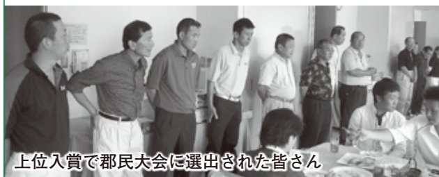
上位入賞で郡民大会に選出された皆さん