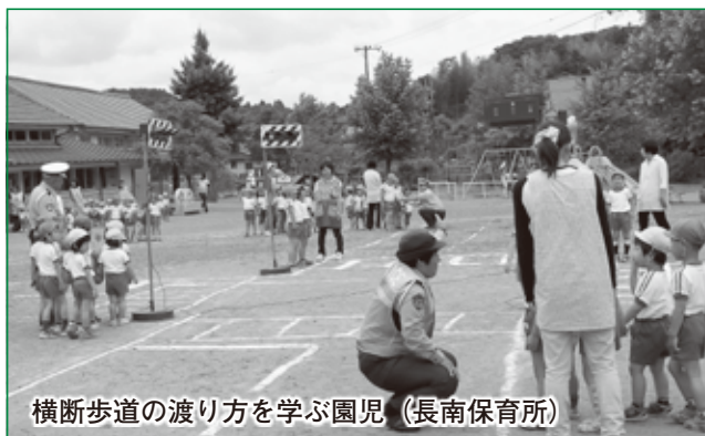
横断歩道の渡り方を学ぶ園児(長南保育所)