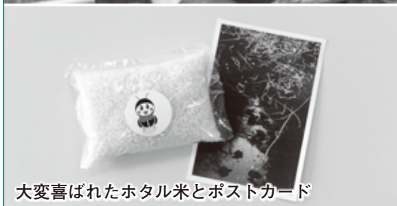
大変喜ばれたホタル米とポストカード