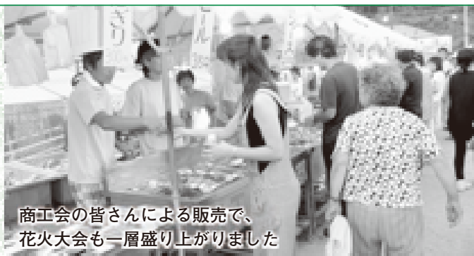
商工会の皆さんによる販売で、花火大会も一層盛り上がりしました

また、町の特産品が販売され、買い求めた人は「毎年この販売を楽しみにしています」と袋を抱えて話してくれました。