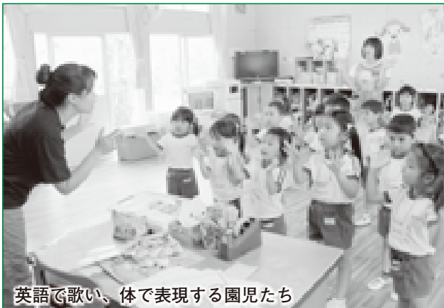
英語で歌い、体で表現する園児たち