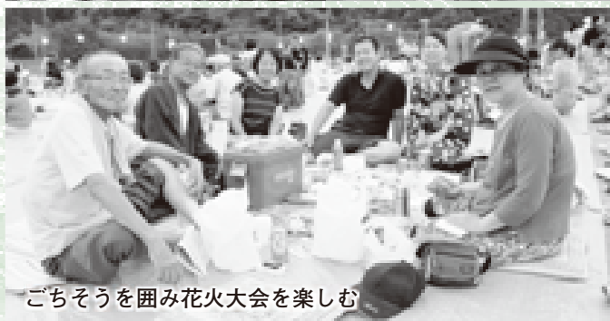
ごちそうを囲み花火大会を楽しむ