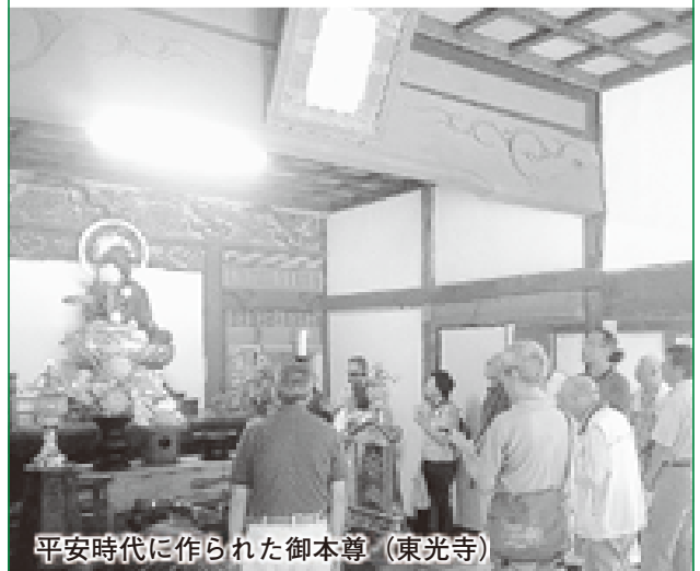
平安時代に作られた御本尊（東光寺）