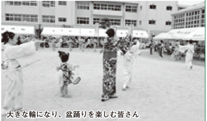
大きな輪になり、盆踊りを楽しむ皆さん

会場では、青少年相談員やPTAによる、やしそば、かき氷などの模擬店が大会を盛り上げていました。