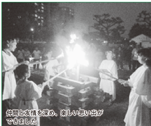
仲間と友情を深め、楽しい思い出ができました