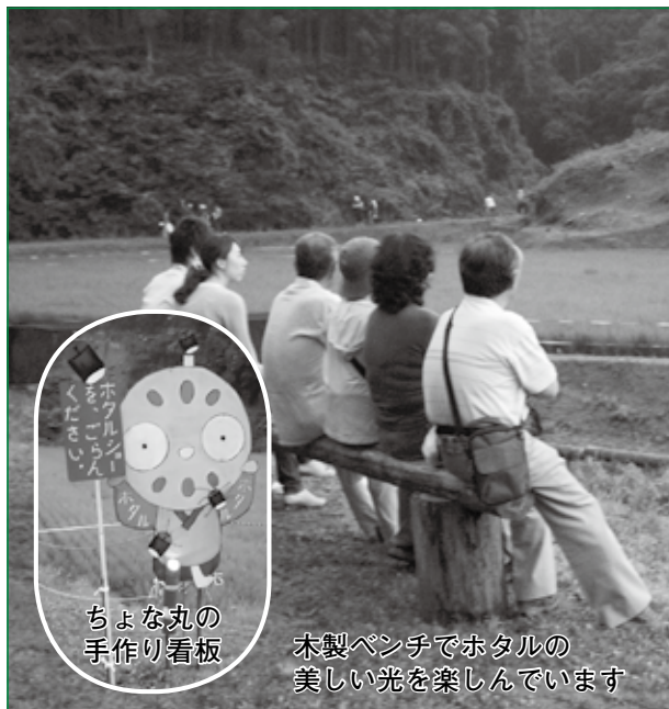
ちよな丸の 手作り看板