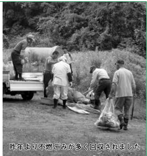
昨年より不燃ごみが多く回収されました