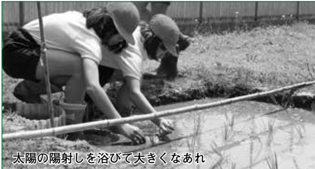
太陽の陽射しを浴びて大きくなあれ