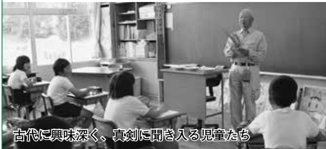
古代に興味深く、真剣に聞き入る児童たち