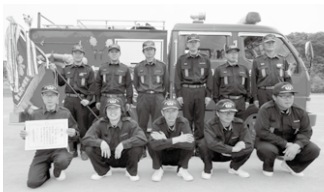
ポンプ車操法団体の部で最優秀賞に輝いた第3分団第1部の団員