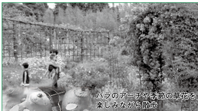
バラのアーチや季節の草花を 楽しみながら散歩