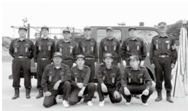
小型ポンプ操法団体の部で最優秀賞に輝いた第2分団第3部の団員