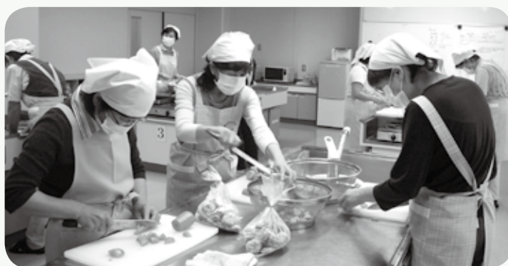
見守り活動を兼ねた独り暮らし高齢者などへの給食サービス事業 ～ボランティアさんの手作り弁当～