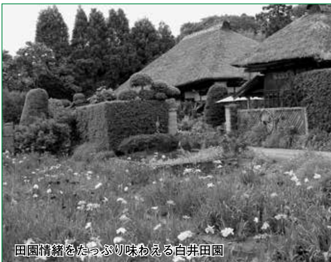
田園情緒をたっぷり味わえる白井田園

会場では、アート作品の展示、野点、さわやか合唱隊による「みんなで歌おう」など楽しいイベントで盛り上がり、来園者は一日のんびり過ごしていました。