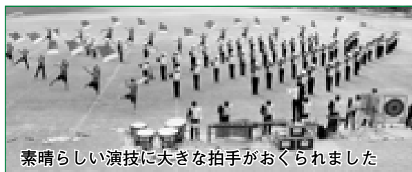
素晴らしい演技に大きな拍手がおくられました