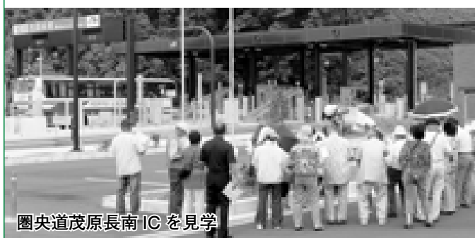
圏央道茂原長南ICを見学

参加者から「町の現状が手に取るようにわかった」などの感想があり、充実した1日を過ごされました。