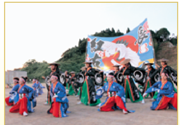
華やかな演舞で花火大会を 盛り上げる長南紅古蓮の皆さん