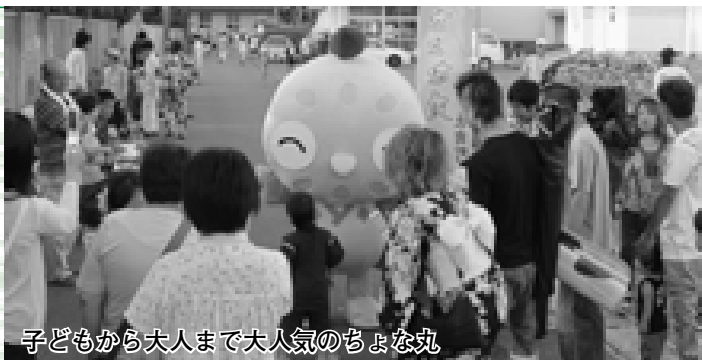
子どもから大人まで大人気のちや丸

音楽と花火を融合させた幻想的なスターマインやワイドスターマインなど趣向を凝らした華麗な花火が次々と開花し、会場は大きな歓声と拍手の渦に包まれました。