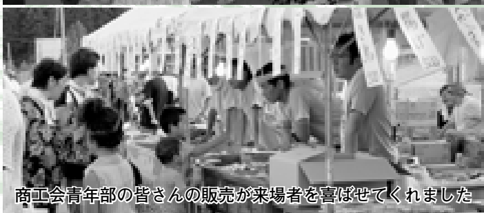
商工会青年部の皆さんの販売が来場者を喜ばせてくれました