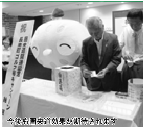
今後も圏央道効果が期待されます

8月11日、各ゴルフ場で厳正に抽選され1,600人が当選しました。新米の長南産米コシヒカリをどうぞお召し上がりください。