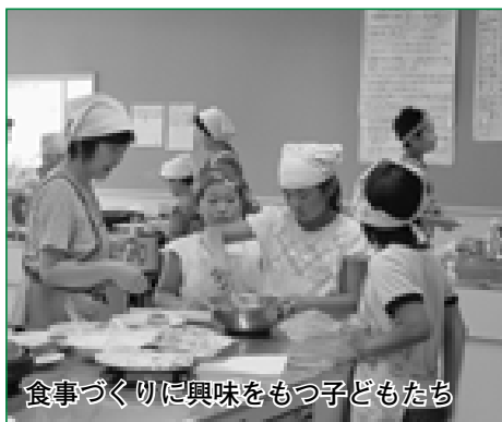
食事づくりに興味をもつ子どもたち

自分の手で生地をこねたり、野菜を切ったりしながら料理が出来ていく様子を楽しみ、達成感を味わうことができた子どもたちは、とてもいい表情をしていました。