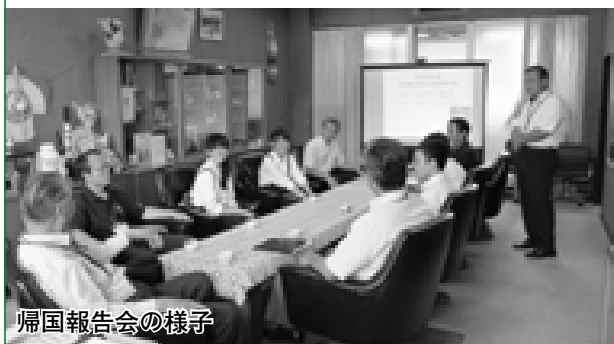
帰国報告会の様子

片言の英語と身振り手振りでコミュニケーションを図り交流を深めてきた研修生たちは、体験談をいきいきと話してくれました。そして、この貴重な体験ができたのは、家族や町、支えてくれた皆さんのおかげだと感謝の気持ちを語ってくれました。