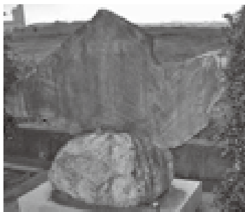
請西藩の屋敷があった真武根陣屋跡。請西藩は戊辰戦争で改易された全国で唯一の藩だった。

閏四月、新政府は政体書を制定しています。その中で地方の統治形態は府藩県三治制と定められ、藩の領内は引き続き藩が統治し、旧幕府領や旧旗本領は新政府直轄地として府・県が設けられました。そして七月二日、上総・安房・下総東部・常陸南部の直轄地の統治責任者として、久留米藩士・柴山典が房総知県事に任命されます。知県事役所は当初八幡宿(市原市)に置かれたましたが、翌八月には長南宿に移転することになります。