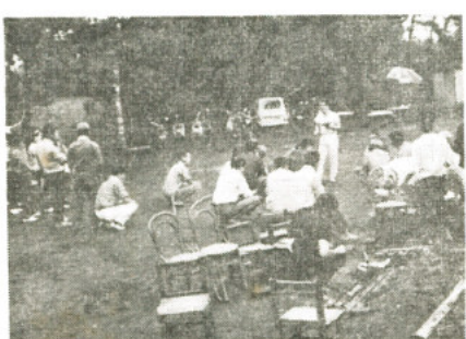
林間学校で学習する青年たち

又農業には従事していても農閑期等には日雇労働等に出稼ぎする青年も相当多く見られるようになった折本町に勤労青少年の学習の場であり、又人間形成の場であり、或は仲間づくりの場である青年学級が青少年の自主性にもついで開設された。