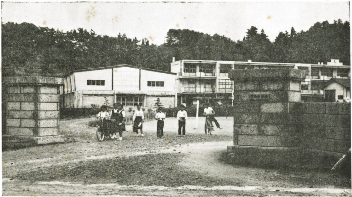
(新しくできた校門と一学期をおえて帰路につく中学生)