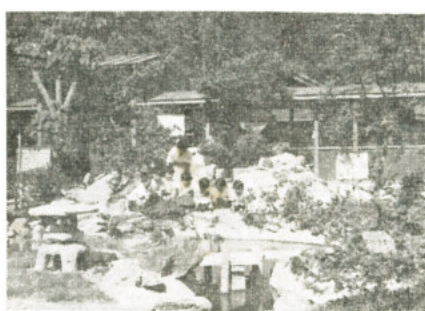
岩石園で学ぶ生徒たち

岩石園の建設資金は児童の廃品回収売上げ金五万円と寄附金を合せ五十万円で行ったもので、県下でも珍しいつばなものと、関係方面からタイコ判を押しされています。