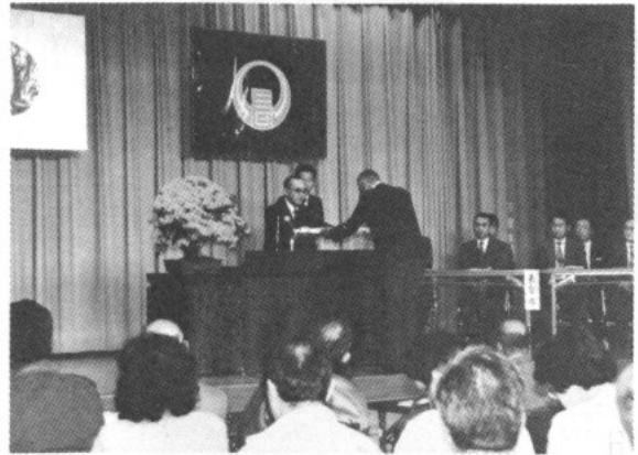
町長から表彰を受ける収納組合長