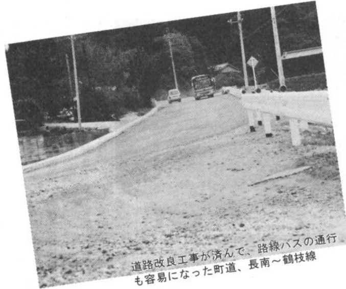
道路改良工事が済んで、路線バスの通行も容易になった町道、長南～鶴枝線

三月末の収入状況は、調定額二十八億三千五百三十九万一千円で収入額二十七億四十二万一千円であり、調定額に対する収入割合は九五・二%です。