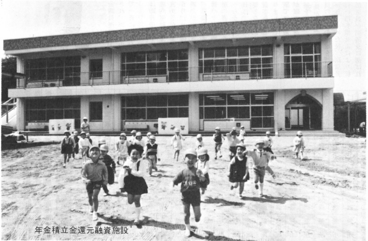
年金積立金還元融資施設