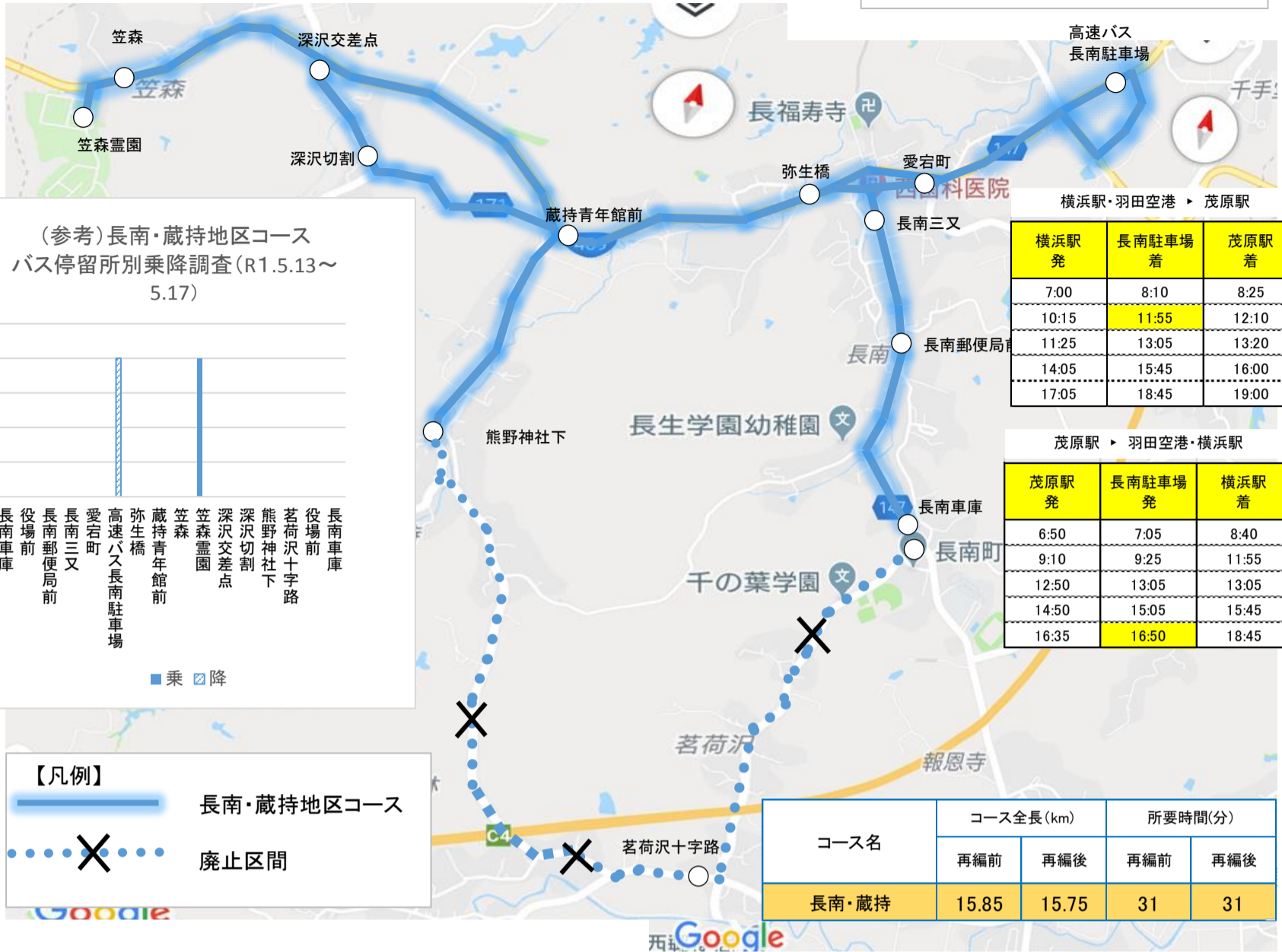
(参考)長南・蔵持地区コース バス停留所別乗降調査(R1.5.13~ 5.17)