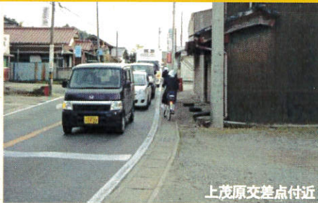
上茂原交差点付近