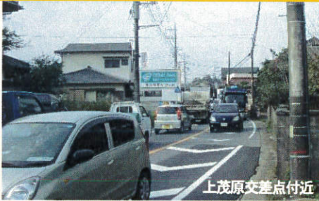
上茂原交差点付近