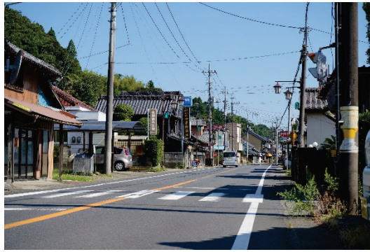
県道 147 号線は歩行者優先の道づくりを検討（長南町）