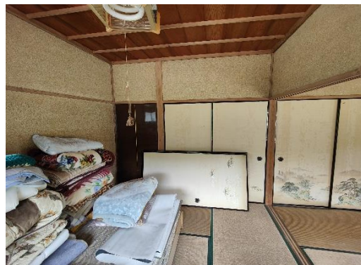
2 階和室 6 畳