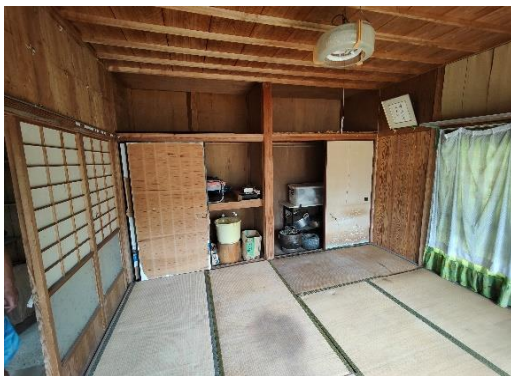
離れ和室 8 畳