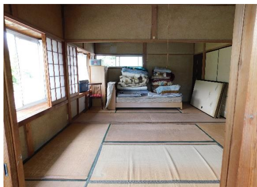
2 階和室 6 畳