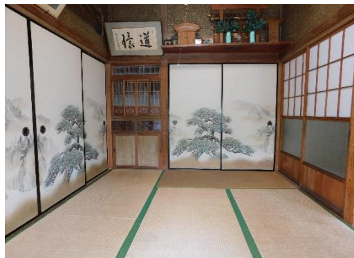
1階和室 6 畳