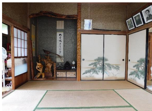
1階和室 8 畳