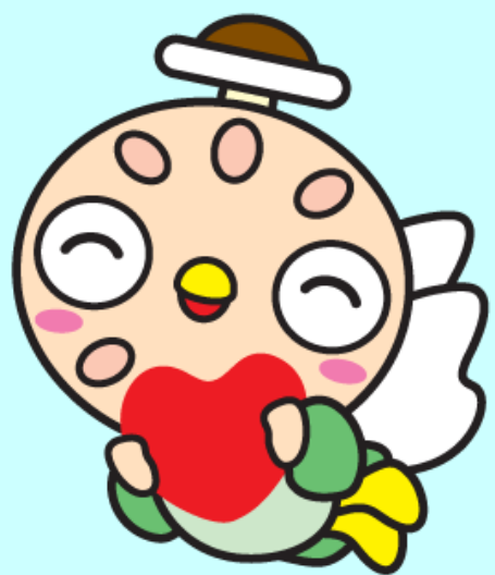
長南町マスコットキャラクター ちよな丸