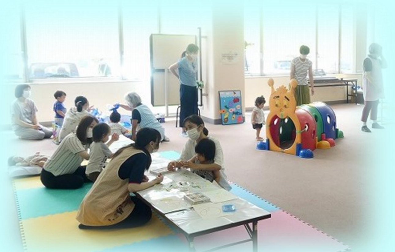
親子ふれあい教室（のびっこ）の様子