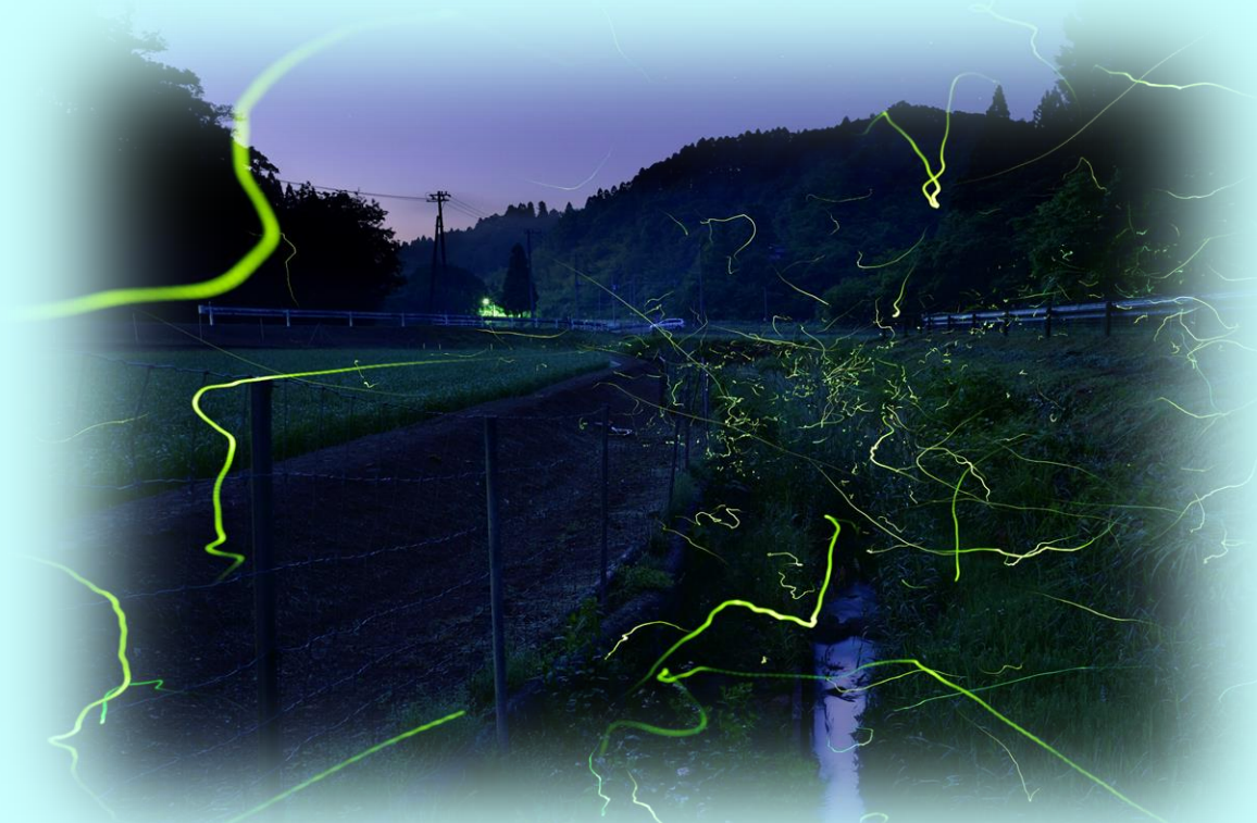
里山を飛び交うホテル