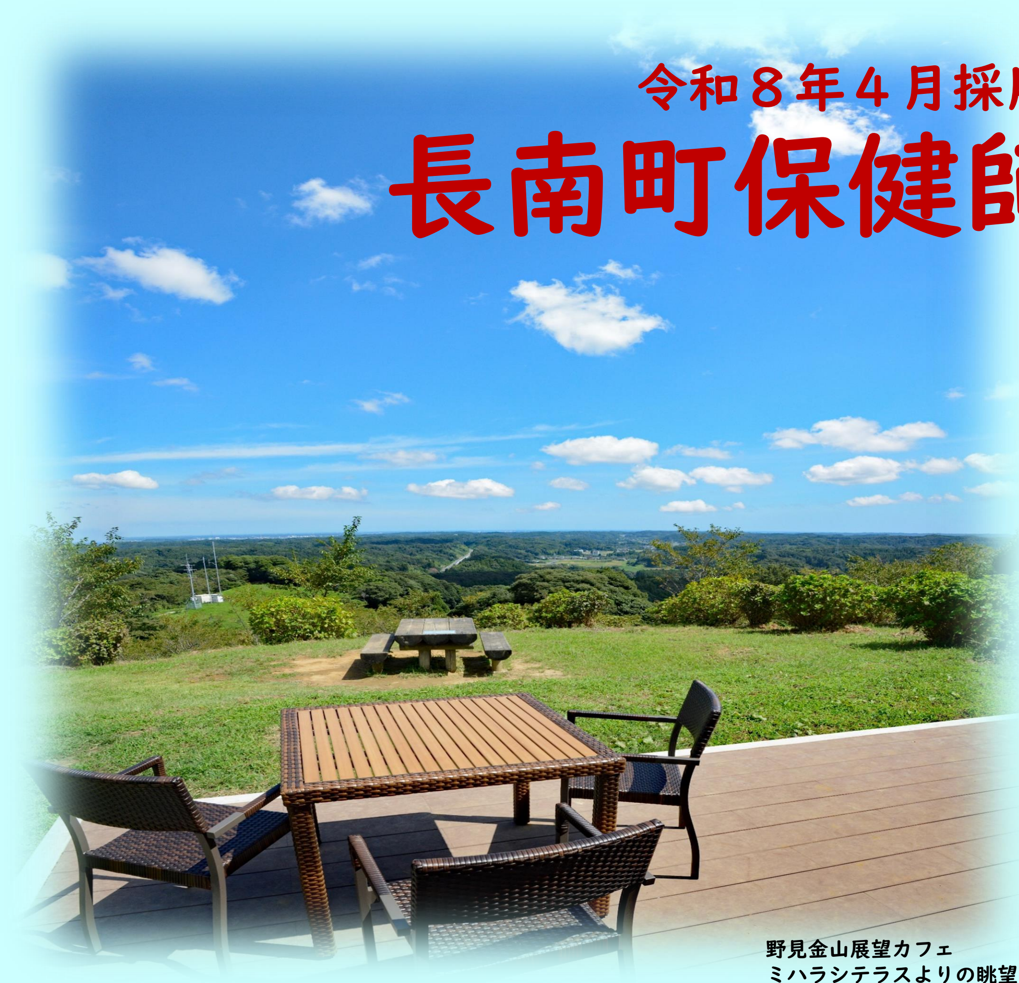
野見金山展望カフェ ミハラシテラスよりの眺望