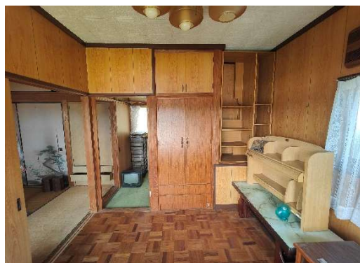
南側棟 2 階洋室