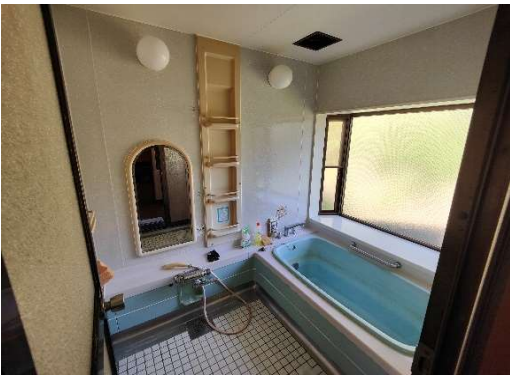
北側棟ユニットバス