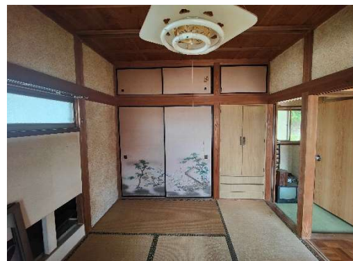
南側棟 2 階和室